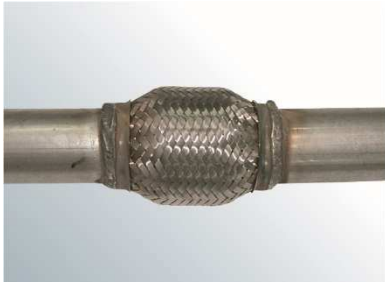
1. Betroffenes Bauteil ausbauen.