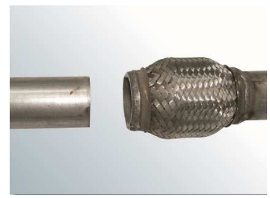
3. Altes Flexrohr entfernen.