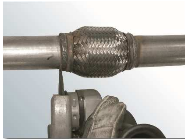
2. An der gekennzeichneten Stelle (hinter der Schweißnaht) altes Flexrohr mit der Flex abtrennen.