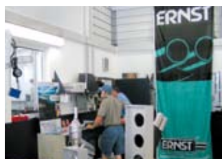
In der Werkstatt wird nicht nur gearbeitet, sondern auch gefeiert. Das Unternehmen ERNST ist fast immer mit dabei.

Bei der Reparatur von Schalldämpferanlagen verbaut der Bosch-Partner fast nur Anlagen des Zulieferers ERNST Apparatebau. In der Werkstatt wird darauf geachtet, dass auch die passenden Montageteile von ERNST eingesetzt werden. Da viele Kunden Fahrzeuge deutscher Hersteller bevorzugen, ist das ERNST-Sortiment genau richtig für die Werkstatt. Für Thomas Häußinger sind die ERNST-