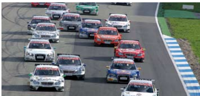
Start in Hockenheim beim Großen Finale der DTM 2006.