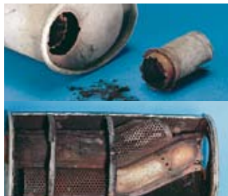
Reflexionsschalldämpfer mit herausgebrochenem Rohr. Ursache ist die fortgeschrittene Innenkorrosion am Siebrohr. Häufig wird bei einem solchen Schadensbild fälschlicherweise eine defekte Schweißnaht diagnostiziert.

22-fache steigen! Die Schadensbilder zeigen es: Infolge der Korrosion von innen rostet der Endschalldämpfer durch.