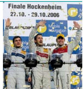
Die Sieger 2006 (v.l.n.r.): Bruno Spengler (2.), Bernd Schneider (1.) und Tom Kristensen (3.)