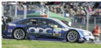
Sympathie-Träger bei den Fans: Der langjährige Opel Werksfahrer Manuel Reuter.