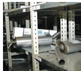
Die Kraft-Zentrallager liefert die Schall-dämpfer direkt in die 100 m entfernte Werkstatt.

diese Produkte. „Außerdem haben wir mit den Schalldämpfern von ERNST noch nie einen Garantiefall gehabt,“ erläutert Helmut Pannek seine Entscheidung für die ERNST-Produkte.