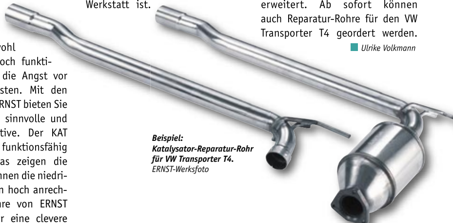
Beispiel: Katalysator-Reparatur-Rohr für VW Transporter T4.

Reparaturlösung, sondern auch ein funktionierendes Kundenbindungsinstrument. Denn ein Kunde, der so gut beraten wurde, kommt bestimmt wieder. In seinem Bekannten- und Freundeskreis wird er sicher erwähnen, wie vertrauenswürdig Ihre Werkstatt ist.