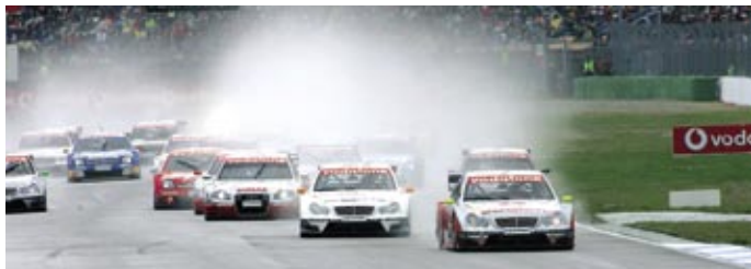
Start zum Finale der Deutschen Tourenwagen Masters Ende Oktober 2005 in Hockenheim.