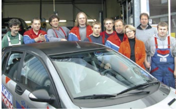
Fünf Gesellen und fünf Auszubildende arbeiten in der Werkstatt.

Bei Pannek werden alle Repara-turen rund um's Auto fachmännisch erledigt. Schwerpunkte liegen vor allem bei der Beseitigung von Unfallschäden, Karosserie-arbeiten sowie Lackierungen aller Art. Natürlich werden auch alle Wartungs- und Inspektionsarbeiten vornehmlich an PKW und Trans-portern durchgeführt. Bei Repara-turen an der Schalldämpferanlage verbaut Helmut Pannek nur Schalldämpfer von ERNST- Apparatebau aus Hagen. Bei den Reparaturen werden auch die Montageteile aus dem gleichen Haus ein-gesetzt. Die hohe Qualität und gute Passgenauigkeit sprechen für