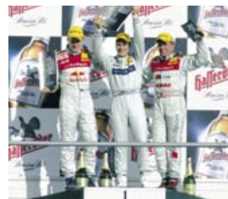
Die Gesamtsieger 2005 (v.l.n.r.): Mathias Ekström, Garry Paffett, Tom Kristensen.